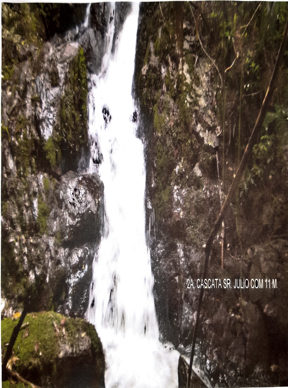
2A. CASCATA SR. JULIO COM 11 M.